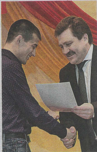
Радостный момент награждения