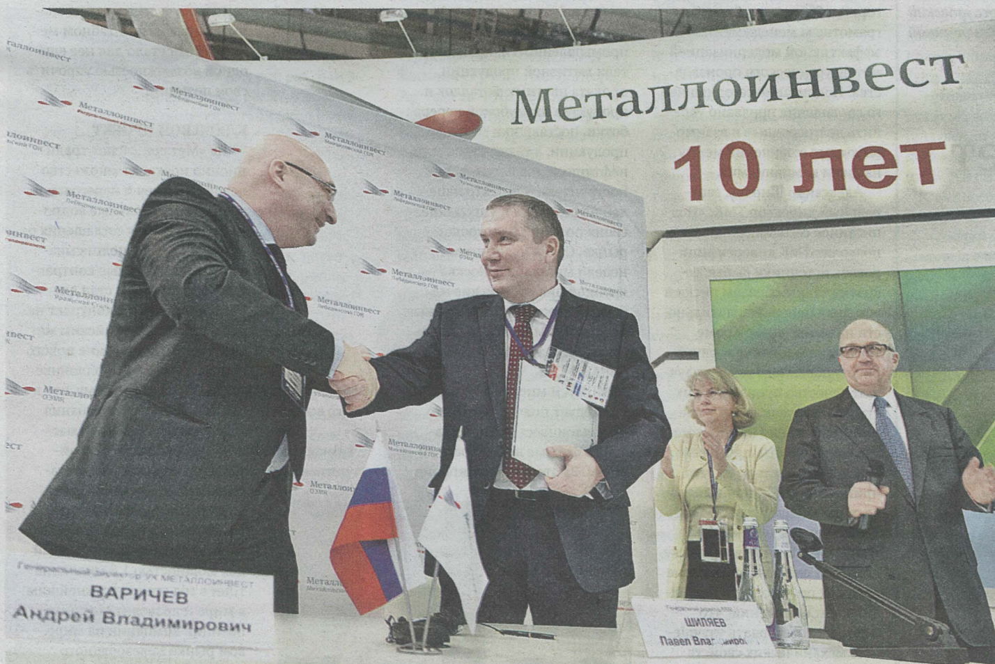
Металлоинвест подписал долгосрочные контракты на поставку горячебрикетированного железа сразу с тремя российскими предприятиями

На Международной промышленной выставке «Металл-Экспо 2016» Металлоинвест заключил контракты на поставку более полумиллиона тонн горячебрикетированного железа.