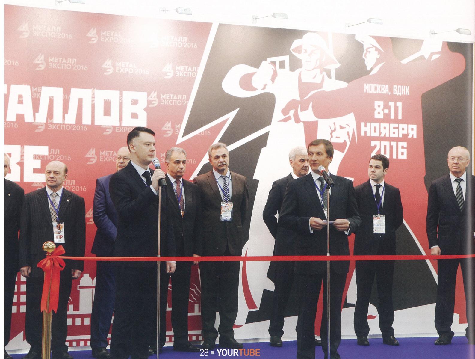
Подписание соглашения между ТМК и компанией «Металлоинвест» на поставку ГБЖ

Традиционно ТМК большое внимание уделила своему стенду. Он был украшен баннерами с фотографиями рабочих