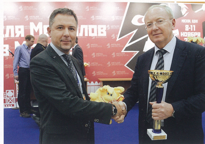
«Экспозиция ТМК – лучшая на «Металл-Экспо 2016»»