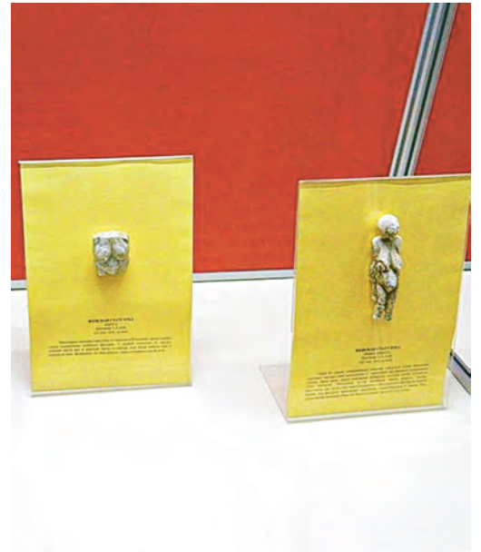
Оригиналы Венер хранятся в городе на Неве.