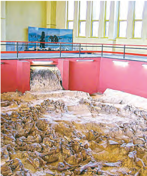
«Фундамент» жилища наших далёких предков.

Так за Полярным кругом называли мамонтов. Но, чтобы увидеть дальнего родича слона, не стоит собираться на край света: поезжайте в Воронежскую область, в село Костёнки.