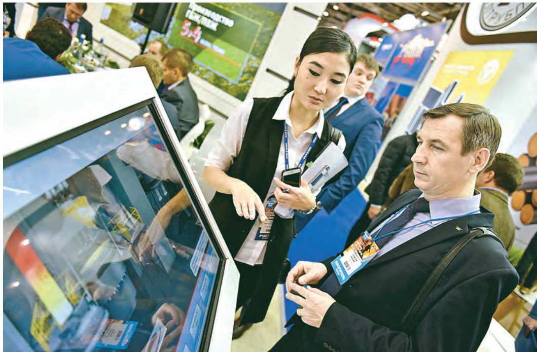
Стенд компании «Металлоинвест».

— Подписанное сегодня соглашение позволит ТМК диверсифицировать источники сырья, сокра-