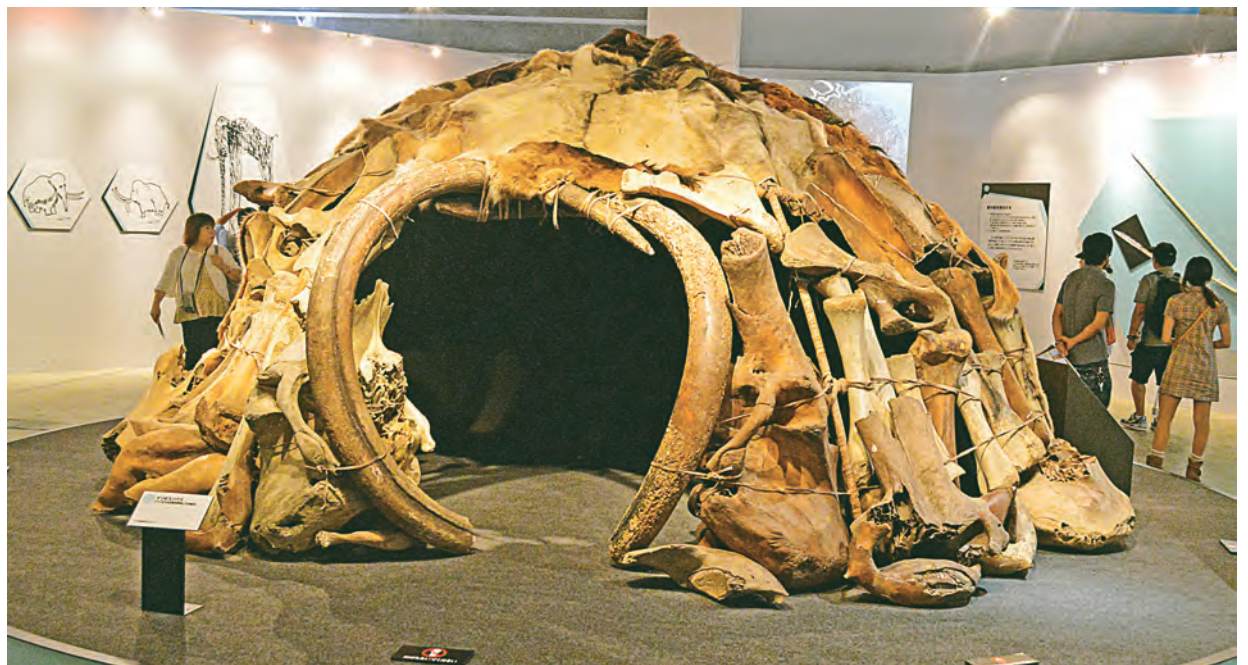
Первобытный хозяин приглашает заглянуть «на огонёк».