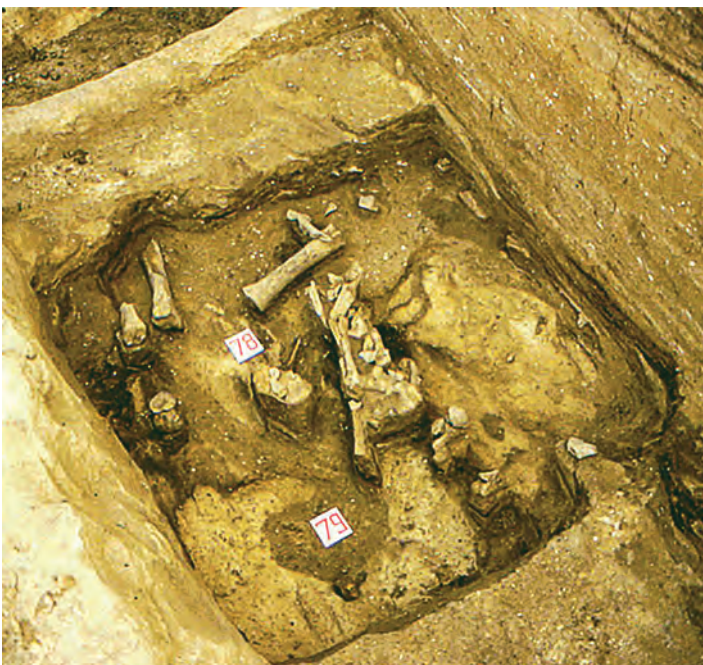
Раскопки продолжают и по сей день.