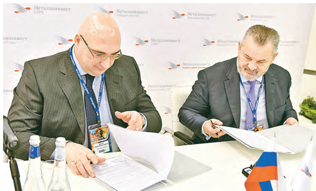
Металлоинвест готовит поставку ТМК 220 тысяч тонн ГБЖ.

тив таким образом риски в условиях ценовой волатильности на рынке лома. Кроме того, использование горячебрикетированного железа улучшит качество производимых сталей, требующих пониженного содержания цветных металлов и вредных примесей.