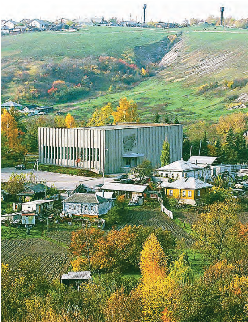
Минули тысячелетия, а природная красота осталась...

Э то путешествие было незапланированным: маленькая дочка, посмотрев мультфильм про маму для мамонтёнка, авторитетно заявила, что ей непременно надо увидеть «мохнатого слоника». Невозможное возможно: село Костёнки, где можно встретиться с доисторическим хоботовым, располагается всего примерно в 40 км от Воронежа в живописном месте у разлива тихого Дона. В один из немногочисленных тёплых дней сентября отправились в путь.