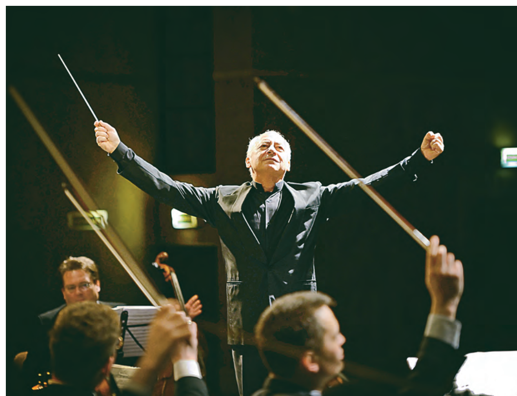
Каждый взмах смычка – это рождение новой мелодии и нового чувства.

Творческие коллективы досугового центра подарили жителям микрорайона хорошее настроение и положительные эмоции. Со сцены прозвучали знакомые и любимые хиты в исполнении солистов вокальной группы «Фантазия», вокального ансамбля «Любава», детского вокального ансамбля «Веселинка» и участников театрального коллектива «Золотой ключик». Праздник собрал сотни людей и по-настоящему порадовал всех.