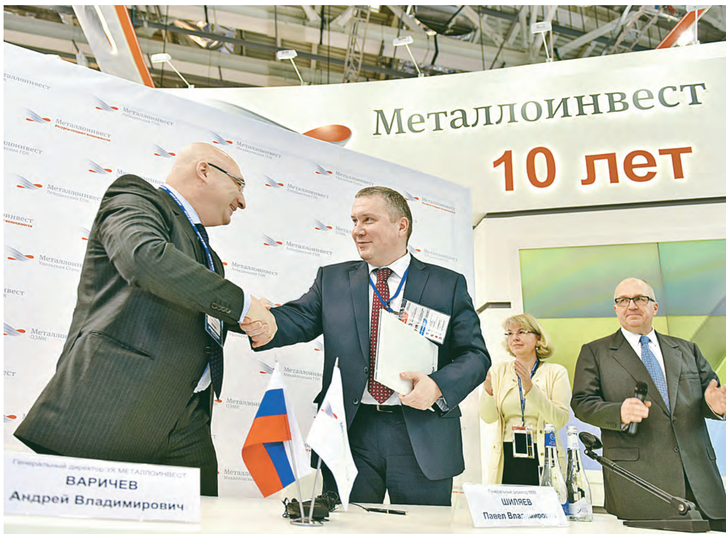
Компания «Металлоинвест» – надёжный и выгодный партнёр.

В рамках 22-й Международной промышленной выставки «Металл-Экспо 2016» Металлоинвест заключил контракты с ММК, ТМК и ЧТПЗ на поставку более полумиллиона тонн ГБЖ.