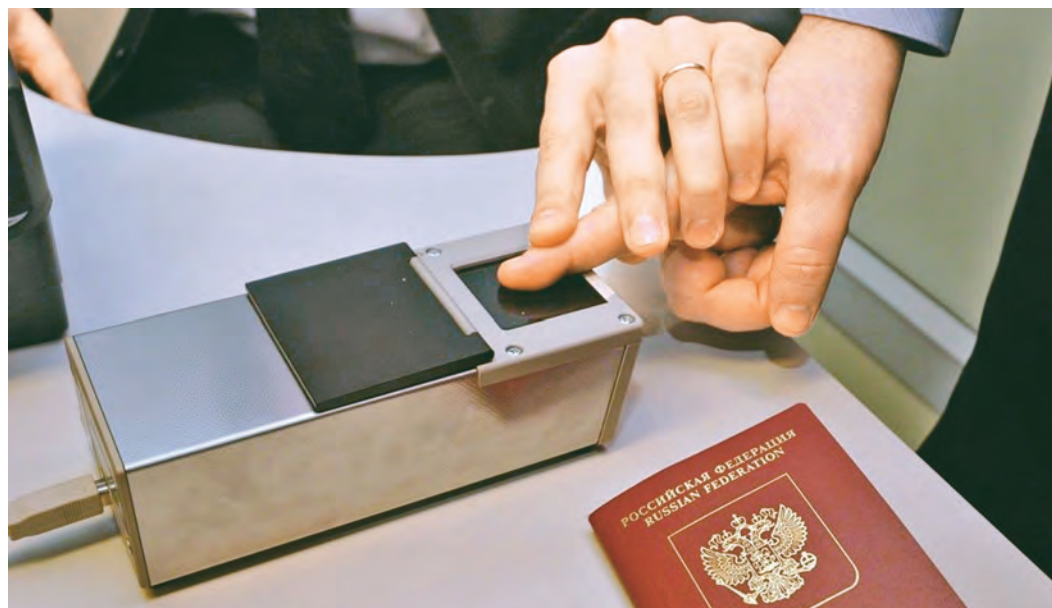
При острой необходимости гражданин может получить загранпаспорт в течение трёх дней.