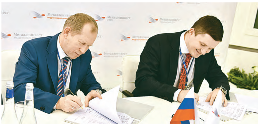
Подписание контракта с Группой ЧТПЗ.

Всего в Международной промышленной выставке «Металл-Экспо 2016» приняло участие свыше 500 компаний из более 30 стран мира. Это ведущие металлургические холдинги, предприятия трубной промышленности, производители метизной продукции, проката цветных металлов и продуктов их глубокой переработки, поставщики металлопродукции, а также строители, нефтяники, газо-