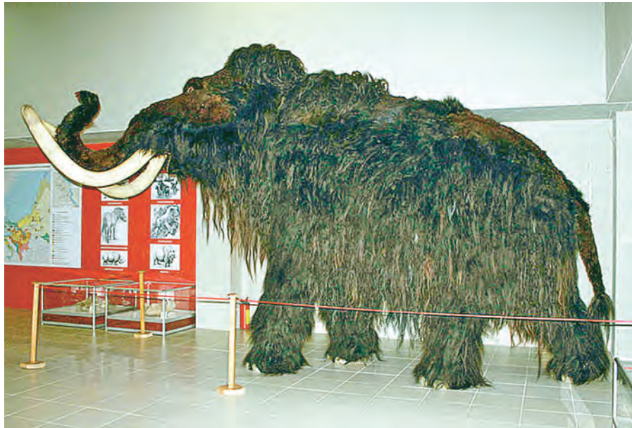
Мамонт Стёпа – любимец взрослых и детей.