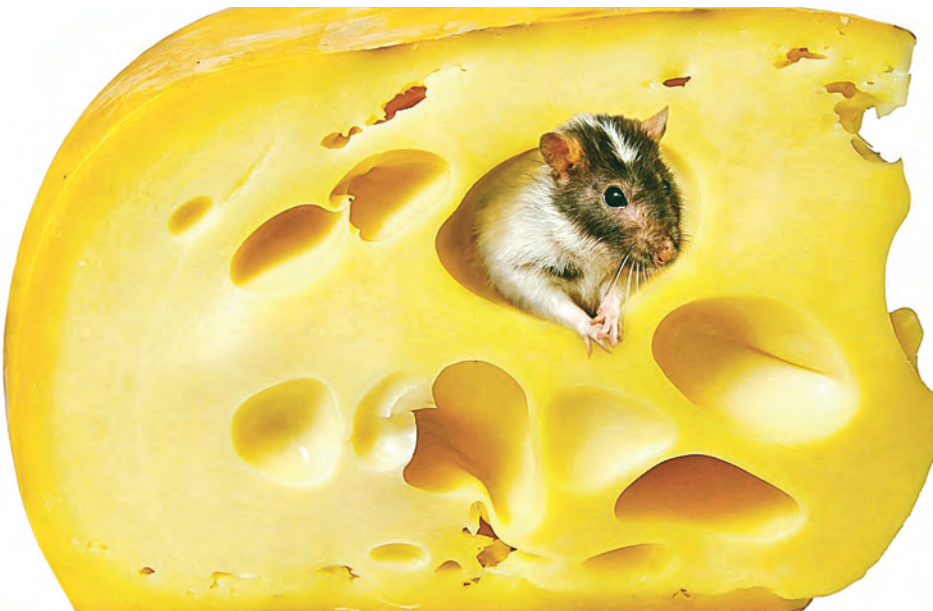
Товар не всегда хорош лицом.