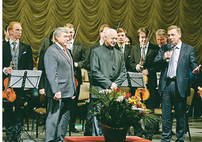
Губкинцы и лебединцы рады новой встрече с «Виртуозами Москвы».

Руководитель коллектива – маэстро Владимир Спиваков как-то сказал: «Музыка – это закодированные эмоции, то, что всегда волновало людей: жизнь, смерть, страдания, слёзы, радость...» 8 ноября в ДК «Форум» прошёл вечер «закодированных эмоций». И не только. Слово само время остановилось, и хронограф отсчитывал не секунды, а музыкальные такты вечной классики и взмахи смычка прославленных исполнителей. Моцарт, Боккерини, Шостакович, поэт танго Пьяццолла... Симфония, арии, полька, ирландская песня, сюита... Восхищение, радость, мечта, тоска, желание пойти в пляс. И слушать волшебную музыку, подаренную «Виртуозами Москвы». Каждое произведение зрители одаивали аплодисментами. А зал был полон. Впрочем, это для «Виртуозов» – явление обычное. Владимир Спиваков вспоминал, что одно время музыканты даже коллекционировали щепки от дверей, разбитых желающими попасть на концерт меломанами. А в Минске на сцену за спины скрипачей однажды поставили 100 стульев, чтобы филармонию не разнесли суровые поклонники тяжёлого рока. В Губкине на сцене тоже стояли стулья, правда, для будущих коллег – студентов музотделения БГИИК. Для них большая сцена пока только мечта. А выдающийся дирижёр в юности романтично мечтал стать морским инженером, но увлёк океан нот и партитур. К счастью! Сегодня он знает шесть языков и в его честь названа малая планета №5410 между